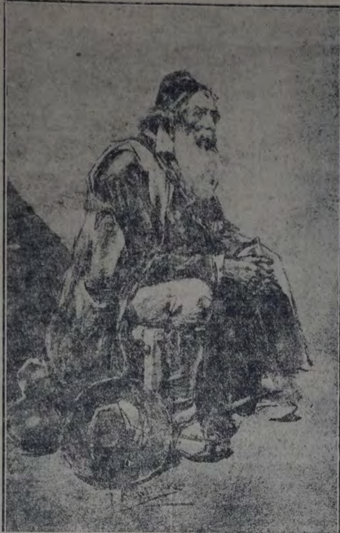
HOMBRE DEL PUEBLO - Por JOSE BENLLIURE