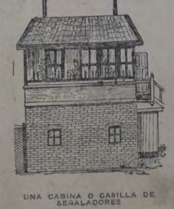
UNA CABINILLA O CASILLA DE SEÑALADORES

El escalafón reglamenta luego los exámenes, vísticos, vestuario, pago de sueldos por enfermedad y por accidentes, notificación de medidas disciplinarias, transacciones, forma de dirigir las reclamaciones, rebaja de personal y postergación del mismo por castigo, ausentismo del personal, pasajes escolares para los hijos de los empleados, beneficios al personal jubilado, y licencias por prescripciones.