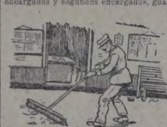
LIMPIEZA DE LAS ESTACIONES A ULTIMA HORA

Entre el personal de tráfico merecen citarse los controladores de estación, que son bastante numerosos en las estaciones importantes y que comprende a los empleados que tienen las siguientes designaciones en las diversas empresas: apunadores, ayudantes, capataces y subcapataces, controladores, casilleros, checkers, descargadores, entregadores, encargados y segundos encargados, guardatrén.